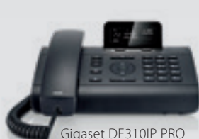
Gigaset DE310IP PRO

Les terminaux Gigaset pro suivant sont disponibles pour une utilisation optimisée avec le Gigaset pro Hybird 120 :