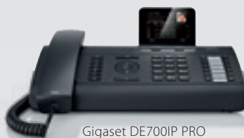
Gigaset DE700IP PRO