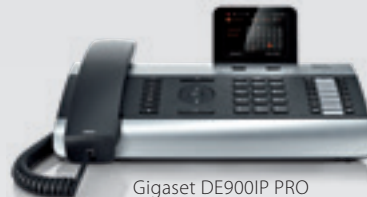
Gigaset DE900IP PRO