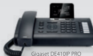
Gigaset DE410IP PRO